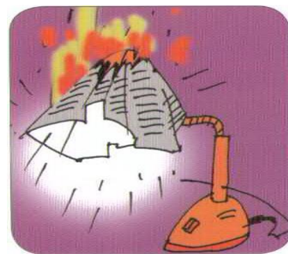
Легковоспламеняющиеся предметы, горючие вещества вблизи нагревательных приборов

Соблюдайте правила противопожарного режима!