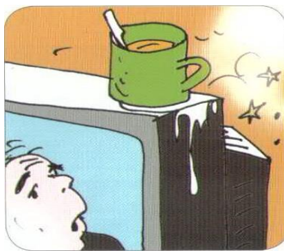
Контакт включенных электроприборов с водой (если это не предусмотрено инструкцией)